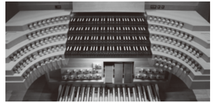
90ものストップ(音色)を備える演奏台